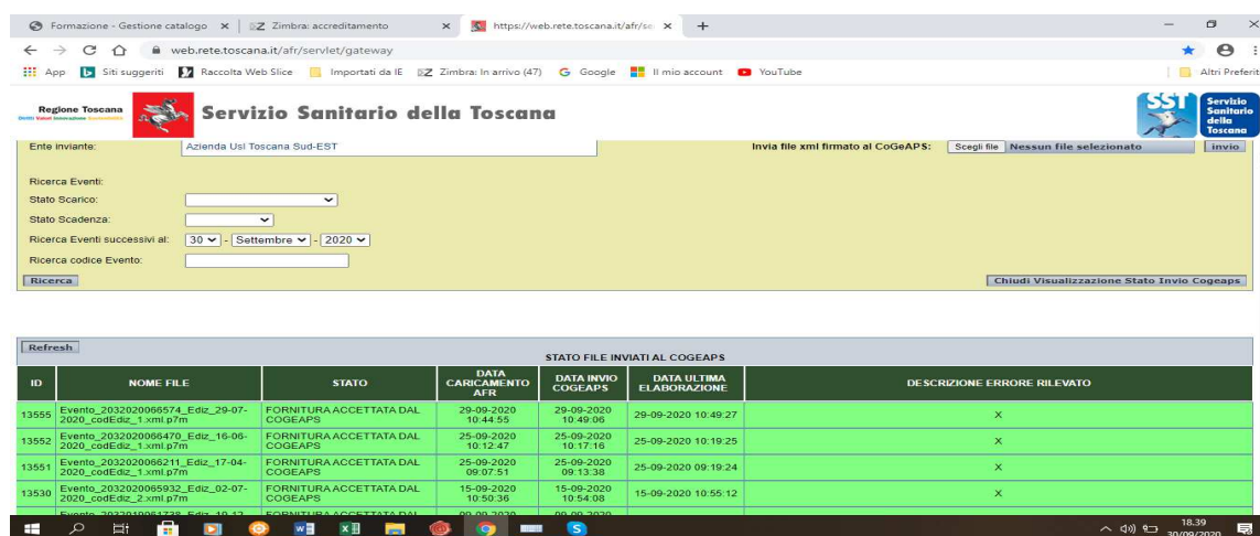
Figura 7 report file inviati al Cogeaps

Nella figura sottostante sono evidenziati i file acquisiti correttamente (in verde). In caso di file non acquisiti (che il sistema evidenzia in rosso) questi vengono controllati nuovamente dal personale della Formazione che provvede, se necessario, a re-inviarli.